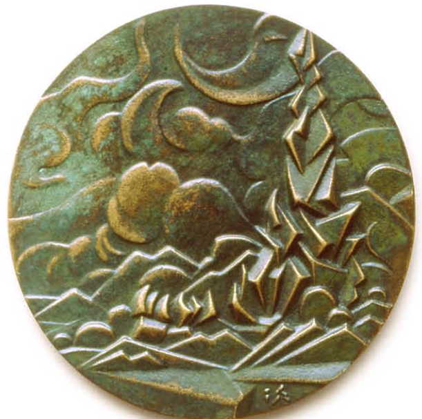
6 Landschap 100 mm Ø brons gegoten, 1993. Szlávic László