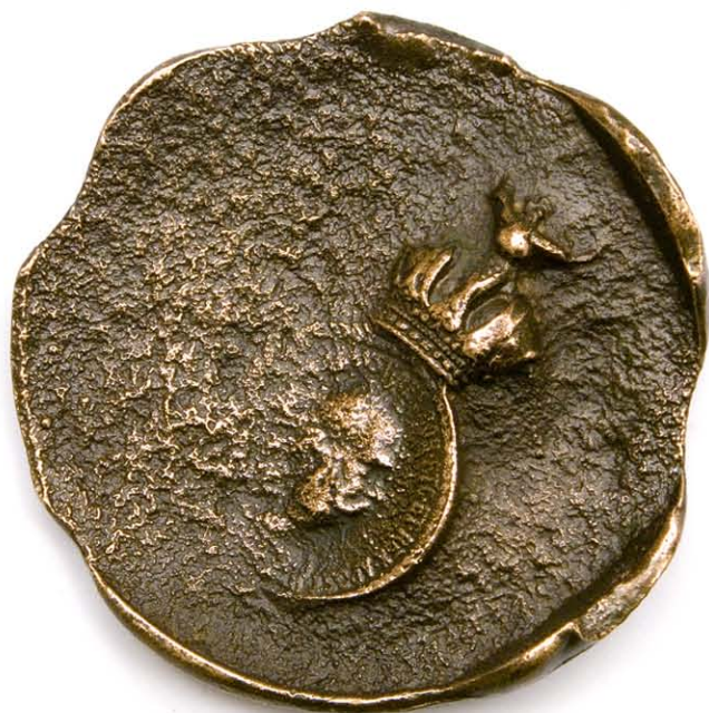
1 Rivieroever 73 mm Ø brons gegoten, 1983. Szlávics László

In zijn serie De vier elementen (vuur, water, lucht en aarde) past hij verschillende materialen en technieken toe. Een uiterste grens bereikt hij met Proto-Money, een combinatie van staal, glas en veren. Szlávics is daarmee een ideaal voorbeeld van de medailleur die in zijn eerste jaren een traditionele stijl hanteert, en dan de ommezwaai maakt naar experimente-