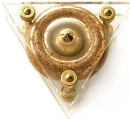
9 Vier elementen (Aarde) 83x83 mm plexiglas, kurk, koper, 1995. Szlávics László

In Hongarije bloeit de penningkunst door de vele goede medailleurs die het land kent. Een aantal van hen heeft de laatste twee decennia de traditie losgelaten, mede door invloeden van de FIDEM-tentoonstellingen en is overgegaan tot het maken van experimentele penningobjecten, waarin