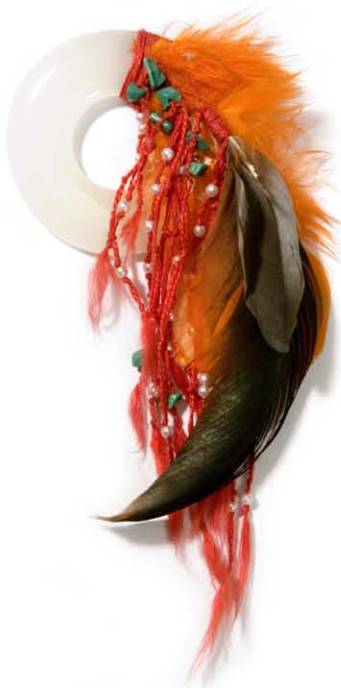
10 Cultic Proto-Money II 80x150 mm onyx, veren, glazen kralen, 1996. Szlávics László

Informatie: U kunt op zijn site de teksten lezen in het Hongaars, Engels, Duits en Frans: http://www.szlavics.com