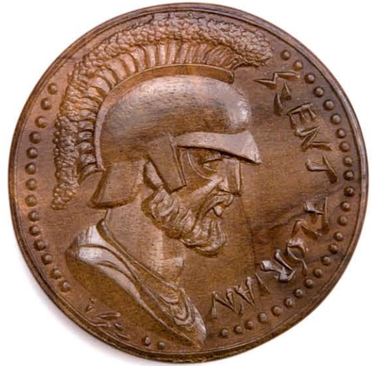
4 Sint Floris 52 mm Ø walnoot geslagen, 1990. Szlávic László

le objecten, zoals de afbeeldingen duidelijk tonen.