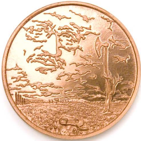
7 László Szlávics 42,5 mm Ø koper geslagen, 1994. Szlávics László