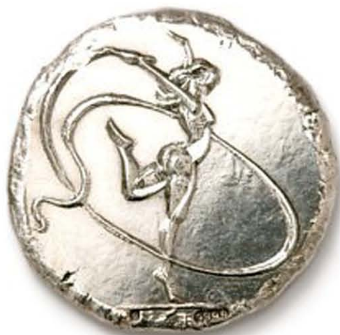
2 Gymnast 39 mm Ø zilver geslagen, 1987. Szlávics László