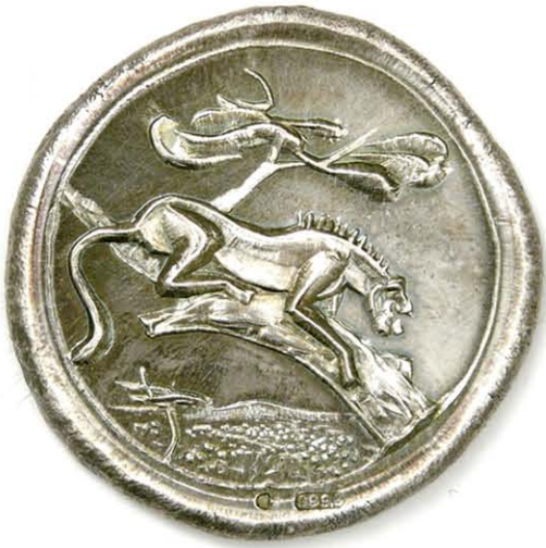
3 Cheetah 44 mm Ø zilver geslagen, 1988. Szlávic László