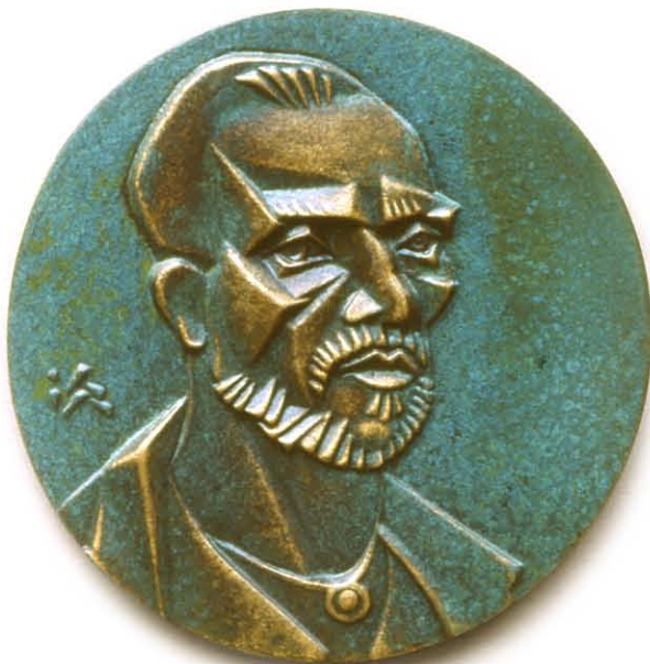
5 Zelfportret met baard 100 mm Ø brons gegoten, 1993. Szlávic László

Primitief geld als inspiratiebron: Cultic Proto-Money II 80x150 (afbeelding 10), versierd met glazen kralen en veertjes. Voor verzamelaars van vroege betaalmiddelen is dit een zeer herkenbaar voorwerp, omdat het dicht bij de bovengenoemde bron blijft. Met staal, bot en veren maakte hij een Herinneringspenning (afbeelding