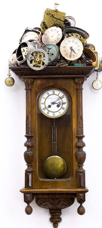
„Száz év magány”, 2016.