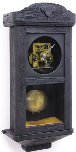
Sötét óra, 2017.