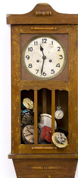
Elveszett óra, 2016.

halmozása, egymásra rakódása; a kifcamodott ingák, rugók, kerekék a fölöslegesség érzetét keltik: nem lehet végső bizonyosságunk az időről, amely napjaink kísérője. Az idő megtréfál bennünket, csúfot űz belőlünk: miközben megpróbáljuk mérni és követni, ő túlesz rajtunk: így könnyen a kiábrándultság és csalódottság érzése támadhat bennünk. Szlávics óraszobrainak groteszk formái csúfodárasan mutogatnak felénk, így emlékeztetve bennünket az elmúlás elkerülhetetlen voltára. Egyik óraszobra ( Száz év magány ) antropomorf vonásaival hasonló a barokk festményeken ábrázolt öreg kurtizánhoz, aki saját maga egykori vonásait keresi a tükörben, mint François Villon szép kovácsnéja.